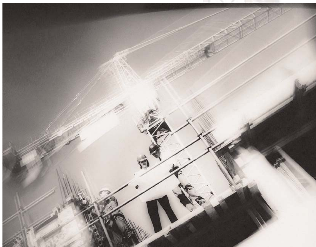
Fig. Alle gegevens worden ingegeven en centraal bewaard. In 2 stappen print of mail je vervolgens bijv. een Technische Fiche.